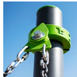
RODAMIENTOS Y PARTES MÓVILES 1 AÑO