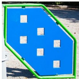
PIEZAS PLÁSTICAS 1 AÑO