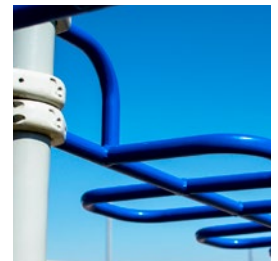
PINTURA ELECTROESTÁTICA 1 AÑO

➤ Las garantías anteriormente especificadas serán efectivas siempre y cuando se cumplan las siguientes condiciones: