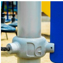
ESTRUCTURA CENTRAL 5 AÑOS